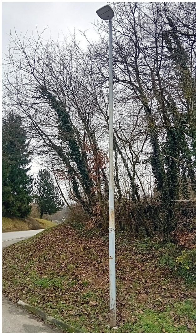
Slika 2: Prerjavel drog v Murnovi ulici