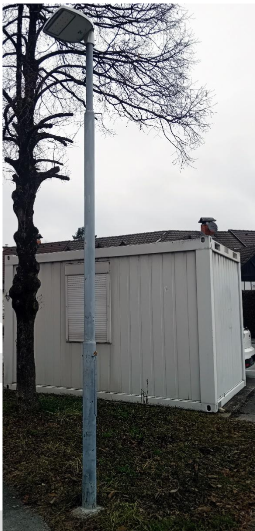
Slika 1: Prerjavel drog v naselju Preska

Pri kandelabrih višjih od 8 metrov se dela izvajajo z avtodvigalom. Po potrebi se vzpostavi delna zapora voznega pasu. Dela se izvajajo v suhem vremenu pri temperaturah nad 5 °C.